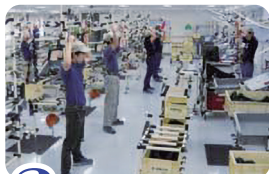
2 始業前の準備体操