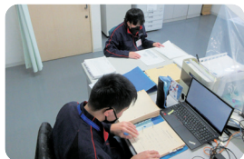
文書データ化作業